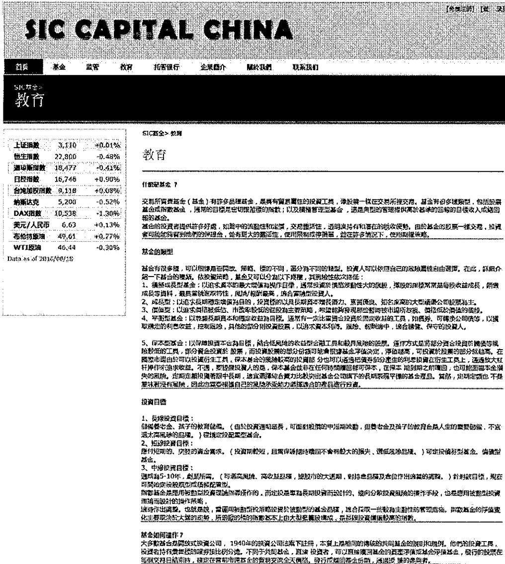
圖 4 SIC 网站-教育 1